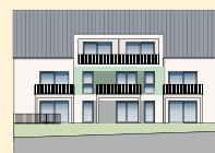
Haus 2 | Wohnung 14 OG | Ansicht West