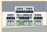
Haus 1 | Wohnung 2 EG | Ansicht Süd