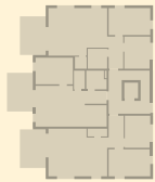
Haus 1 | Wohnung 2 Draufsicht EG