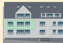
Wohnung 4 | OG Ansicht West