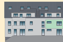
Wohnung 4 | OG Ansicht Ost